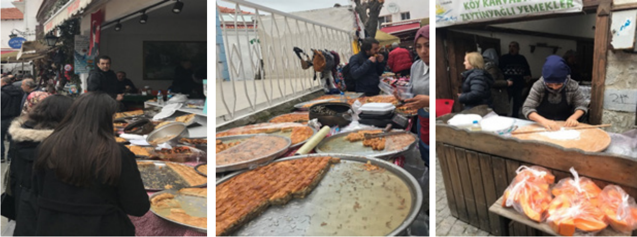
Sığacık köy pazarından görüntüler

Çizelge 1’de de görüldüğü üzere Sığacık Köy Pazarı hakkında toplam 353 yorum yapılmıştır. Sığacık Köy Pazarı hakkında yapılan yorumların %58,35’i mükemmel, %29,74’ü ise çok iyi olarak derecelendirilmiştir. Çevrimiçi yorumlar incelendiğinde, turistlerin memnuniyet, memnuniyetsizlik, beklenti ve deneyimlerini ortaya koyan yorumların yapıldığı görülmektedir. Bu noktadan hareketle, önceden belirlenen bu temalar ışığında kodlar tespit edilmiştir. Böylece, Sığacık Köy Pazarı örneğinde turistlerin gıda pazarı ziyaretlerinde memnuniyet ve memnuniyetsizlik unsurlarının neler olduğu anlaşılma-ya çalışılmaktadır. Bununla birlikte, turistlerin gıda pazarı ziyaretleri neticesinde beklenti ve deneyimlerinin neler olduğu ortaya koyulmaktadır. Şekil 2’de Sığacık Köy Pazarı hakkında yapılan yorumların analizi sonucunda elde edilen tema ve kodlar yer almaktadır.